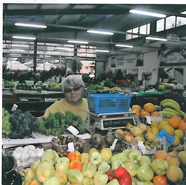
Supermarkt oder Markthalle – noch kaufen die Rumänen Lebensmittel vorrangig in kleinen Geschäften.